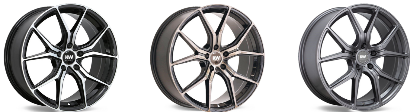
Fås i 5 forskellige farver: Sort/poleret, Sort/bronze front, Gunmetallic, Gloss bronze & Blank sort