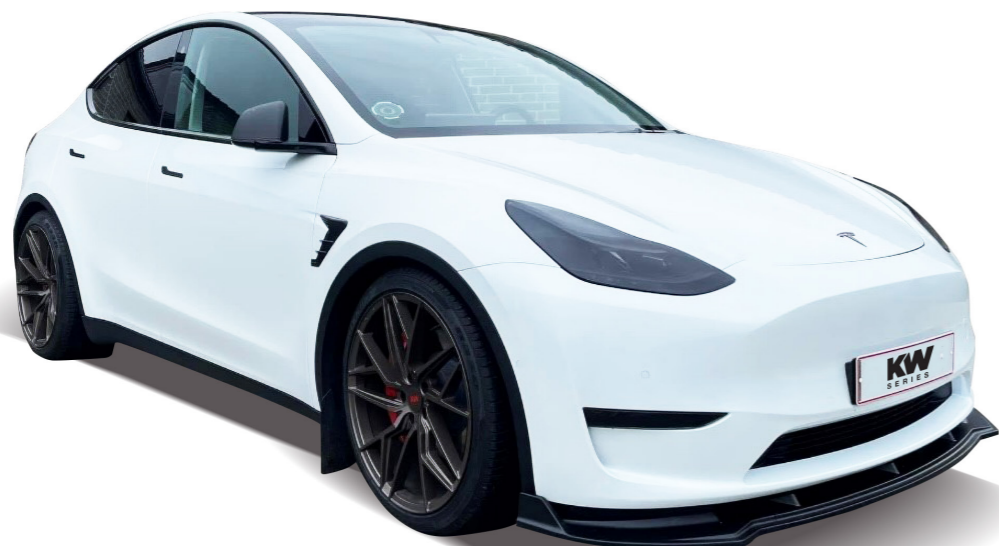
S31, 9+10,5x21 Tesla Model Y

10,5x21 egen vægt, 14,5 kg, max load 815 kg