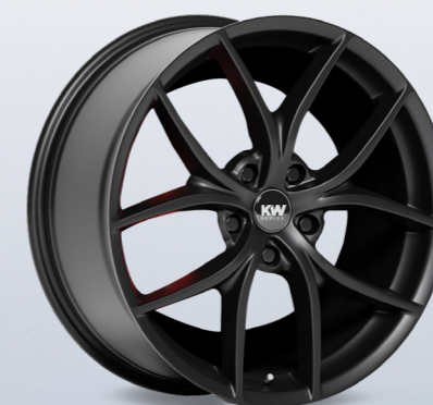
Fås i 2 forskellige farver: Satin sort & Gunmetallic