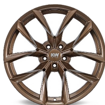
Fås i 3 forskellige farver: Satin sort, Gloss bronze (19 og 20 tommer) og Gunmetallic