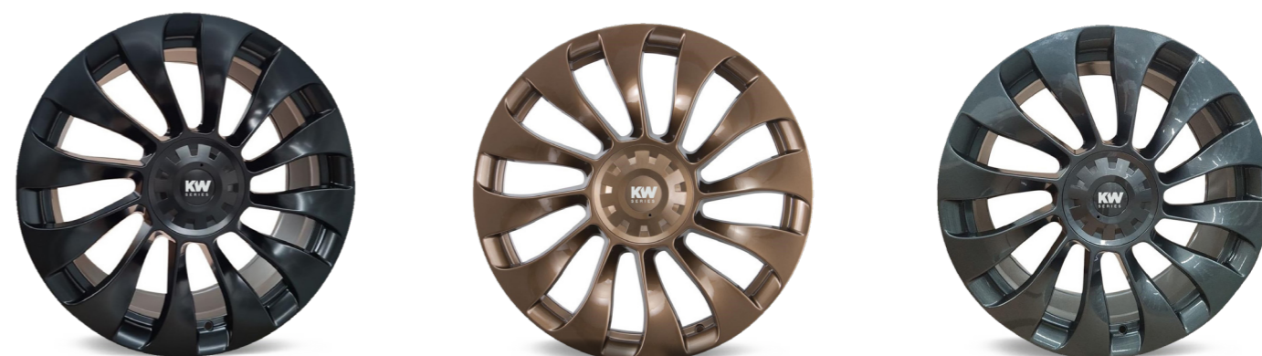
Fås i 3 forskellige farver: Satin sort, Gloss bronze og Gunmetallic (restordre)